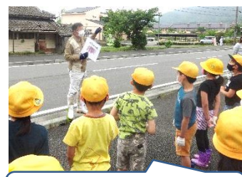
1・2年 サツマイモの苗植え