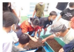
3年 黒豆のたねまき