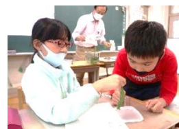
3年 オムラサキの学習